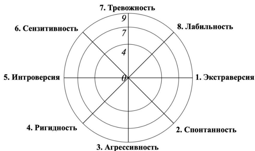
Рис. 2. Схема ортогонально направленных типологических свойств личности (в баллах теста ИТО).

противоположностей, в ортогональном соотношении: каждой тенденции противопоставлена анти-тенденция. Сензитивности (чувствительность, склонность к самограничению, доброжелательность, зависимость) противостоит спонтанность (решительность, лидерство, независимость). Тревожности (осторожность, бегство от опасности, конформность – неконформность, ведомая позиция) - стеничность (агрессивность, смелость, наступательная позиция). Эмоциональной лабильности (компромиссность, неустойчивость к стрессу) – ригидность (педантичность упорство, устойчивость). Интроверсии (сдержанность, замкнутость, индивидуализм) противопоставляется экстраверсия (общительность, открытость, социальность).