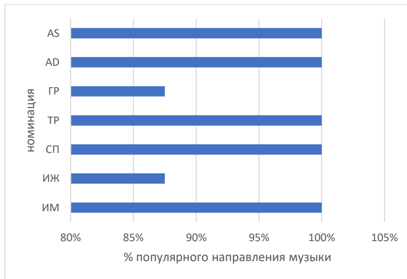
Рисунок 2 – Распространение популярного направления музыки в соревновательных композициях высококвалифицированных гимнастов спортивной аэробики (по данным чемпионата России 2024)

распространённым в соревновательных композициях гимнастов России по спортивной аэробике (рисунок 2).